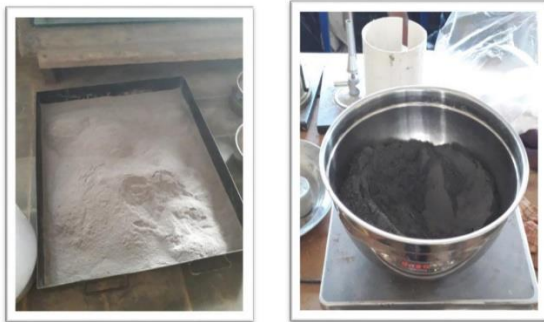
Abu Sekam Padi Abu Batubara Gambar 1. Abu Sekam & Abu Batubara

diantaranya pada lamanya waktu ikatan awal adukan mortar, kekuatannya, serta kekedapan airnya setelah mortar mengeras.