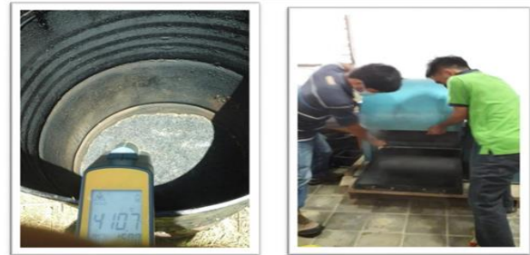
Gambar 2. Proses Pembakaran & penghalusan Abu sekam Padi

Metode pengujian dan peralatan yang digunakan dalam pengujian sesuai SNI atau sesuai persyaratan lainnya dalam metode uji.